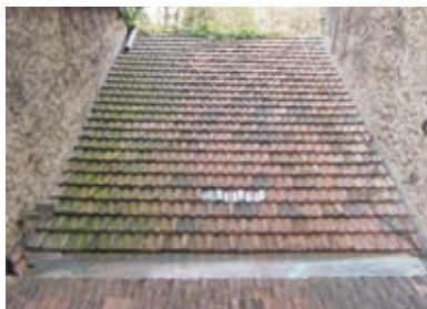
Nach der Oberflächenreinigung