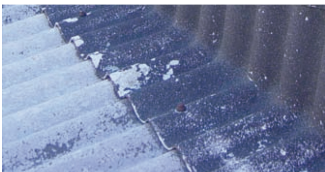
Beschädigte Oberfläche bei Faserzement-Wellplatten