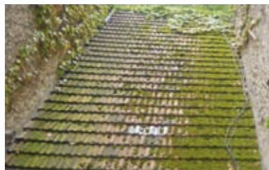
Vor der Oberflächenreinigung