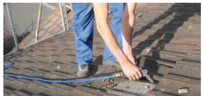
Reinigen des Überlappungsbereich mit Druckluft