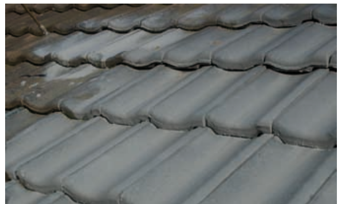
Aufspritzen der Dachbeschichtung